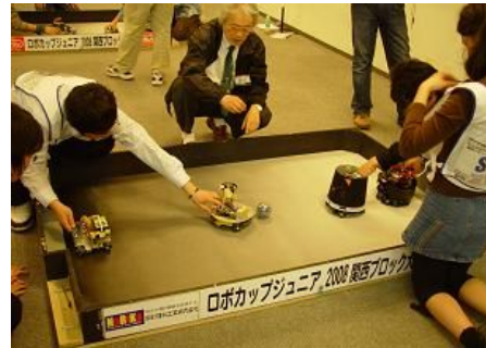
今年からはロボカップジュニアに Beuto を拡張して出場する事例も (大阪市立都島工業高校機械電気科チーム)