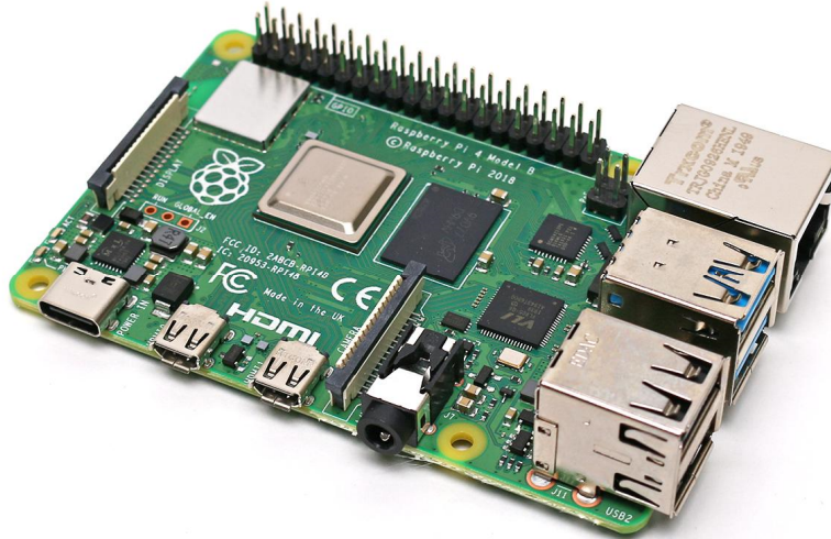
Raspberry Pi 4 Model B

Robovie-Zには、RAM容量4GBのRaspberry Pi 4 Model B基板が搭載されています。1.5GHz クアッドコアのARM® Cortex®-A72プロセッサにより、画像処理やネットワーク連携など、これまでの二足歩行ロボットを超える高度な演算処理を、ロボット本体内で行うことができます。Raspberry Pi 4には冷却用のファンを装着しており、複雑な処理を安定して実行することが可能です。