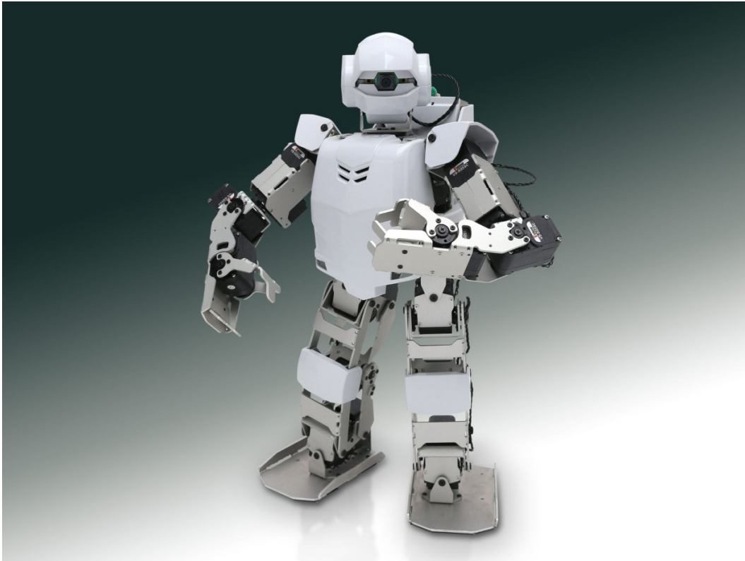
Robovie-Z Raspberry Pi版 ハンドユニット搭載