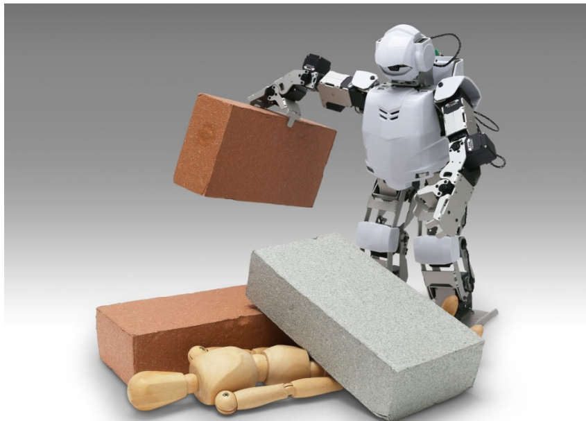
競技会などでの活用が可能 (画像のブロックは発泡スチロール製です)