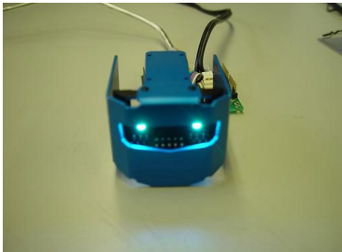
VS-IX004R を RB2000 頭部パーツに搭載